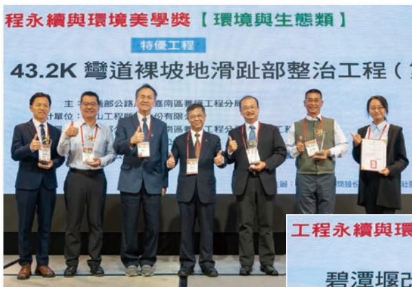
特優 – 台 18 線