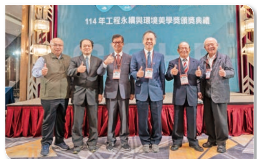
環境與生態類 委員大合照