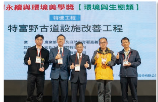
特優 – 特富野古道設施改善工程