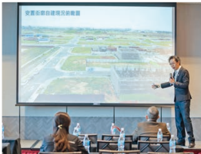
桃園航空城區段徵收工程