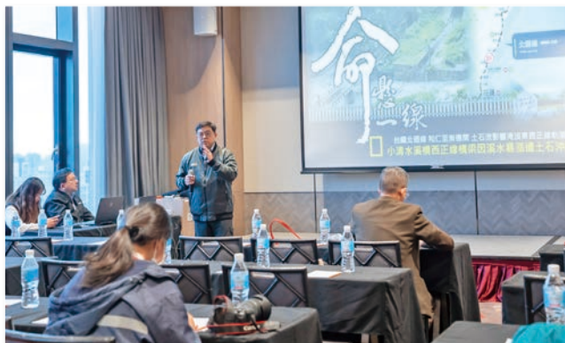
臺鐵小清水溪橋搶修復舊工程專案之整合性數位應用