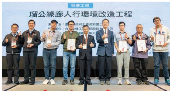
特優 – 瑠公綠廊人行環境改造工程