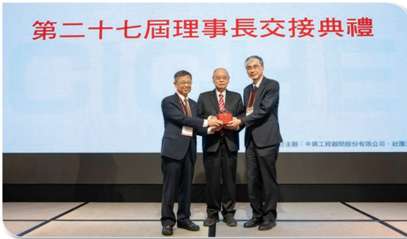
第 27 屆理事長交接儀式