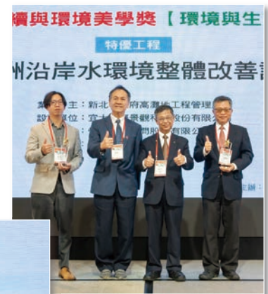
特優 – 淡水河五股蘆洲