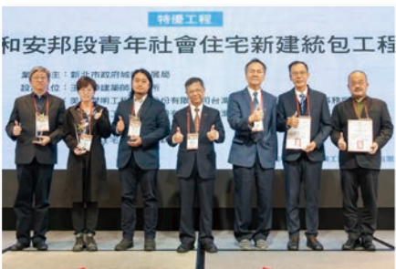
特優 – 中和安邦段青年社會住宅新建統包工程