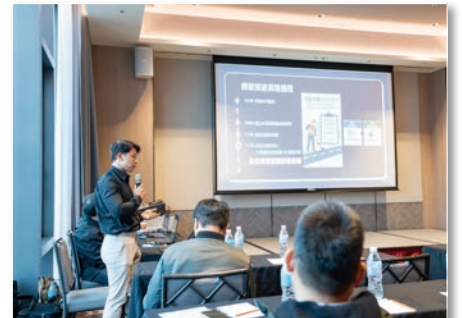
114 年度道路巡查維修修繕成效式契約 (松山、信義區)(第2標)