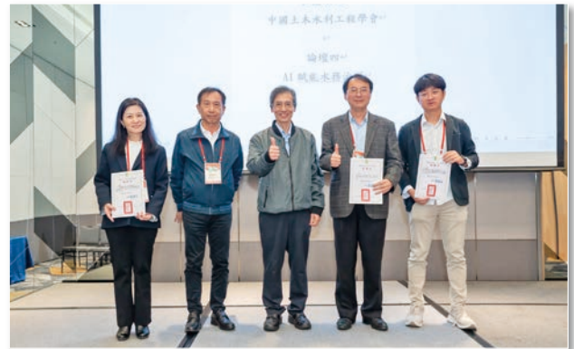
主持人、講者大合照