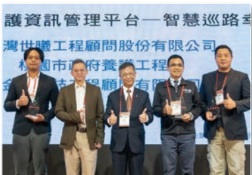
114 年度道路巡查維修修繕成效式契約 (松山、信義區) (第 2 標)