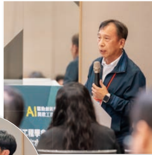
武經文副總經理演講