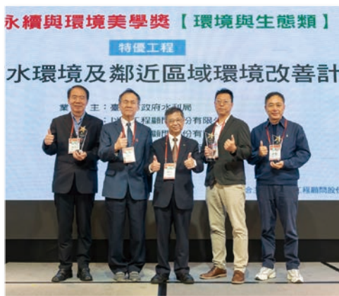
特優 – 東大溪水環境及鄰近區域環境改善計畫