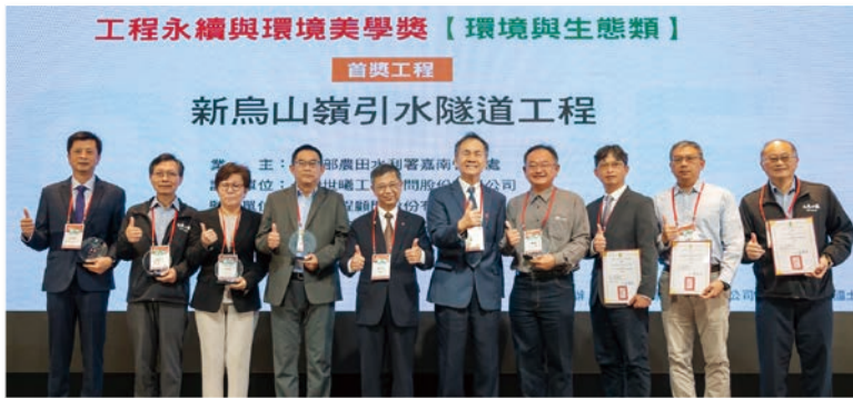
首獎 – 新烏山嶺引水隧道工程