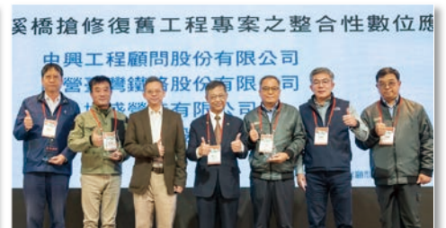
iSlope 邊坡風險管理系統