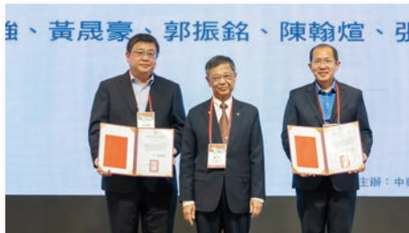
應用物聯網技術長期監測軌道振動及 動態道碴阻力