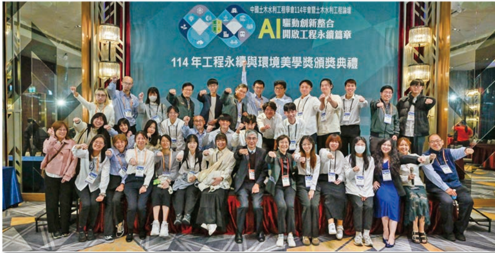
~年會工作人員大合照~