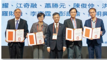
钢筋混凝土外部黏貼碳纖維補強貼片之 錨碇性能試驗研究