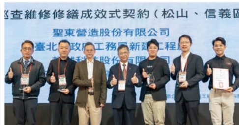
臺鐵小清水溪橋搶修復舊工程專案之整合性數位應用