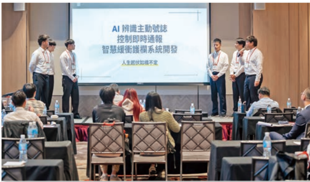
屏東科技大學土木工程系 人生起伏如橋不定 發表