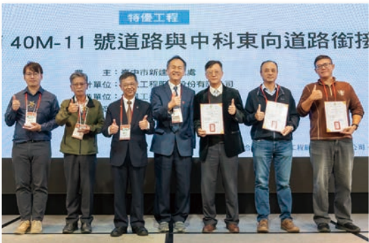
特優 – 臺中市水湳 40M-11 號道路與中科東向道路銜接工程