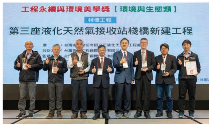
特優 – 第三座液化天然氣接收站棧橋新建工程