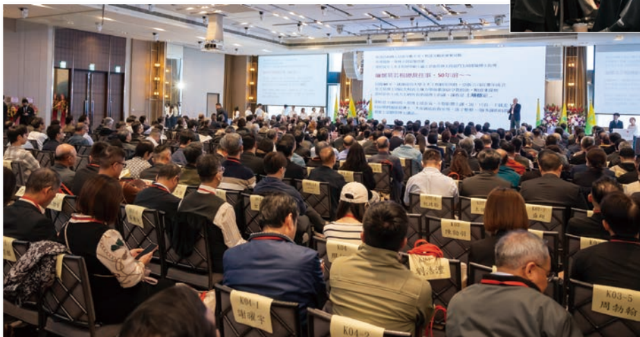
現場貴賓專心聆聽演講