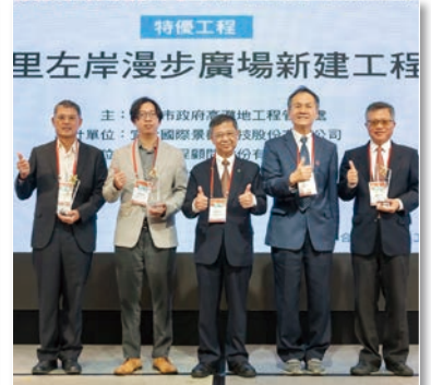
特優 – 八里左岸漫步廣場新建工程