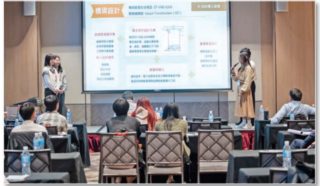
中原大學土木工程學系 凡是橋個原 發表