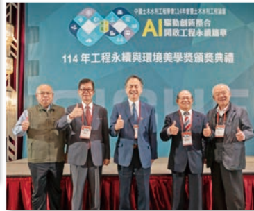
美學與景觀類 委員大合照