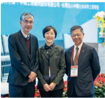
~新舊任理事長及秘書長合照~