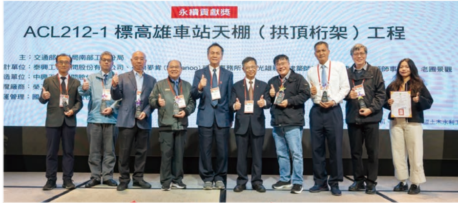
永續貢獻獎 – ACL212-1 標高雄車站天棚（拱頂桁架）工程