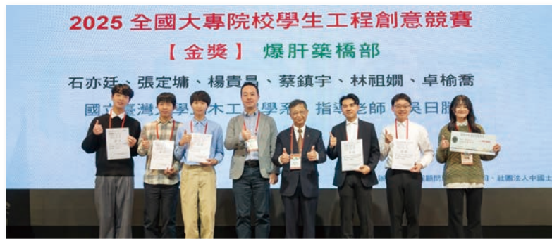
高宗正理事長頒發 金獎—爆肝築橋部 / 國立臺灣大學土木工程學系