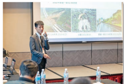
iSlope 邊坡風險管理系統