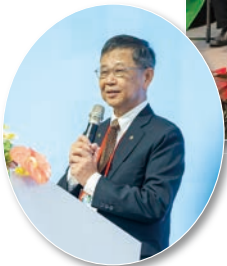
高宗正理事長致詞