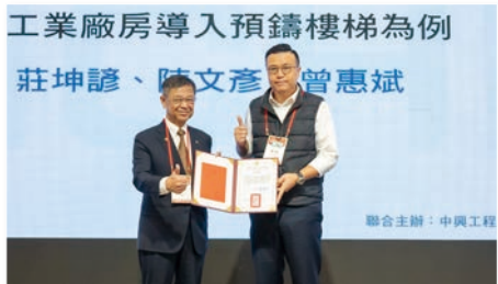
鋼構工程結合預鑄構件設計評估之研究 —以工業廠房導入預鑄樓梯為例