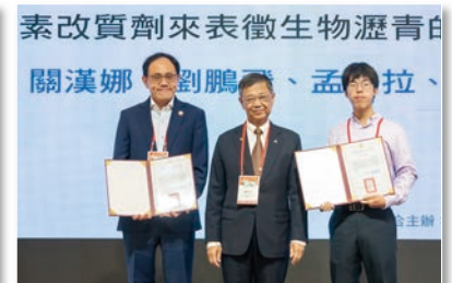
提高瀝青永續性：使用黑液木質素改質 劑來表徵生物瀝青的抗老化性能