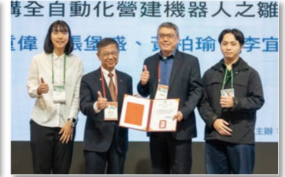
以虛實整合及人機協作為基礎建構 全自動化營建機器人之雛型架構