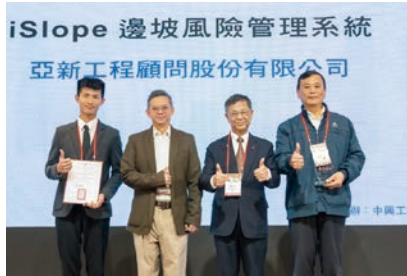
桃園航空城區段徵收工程