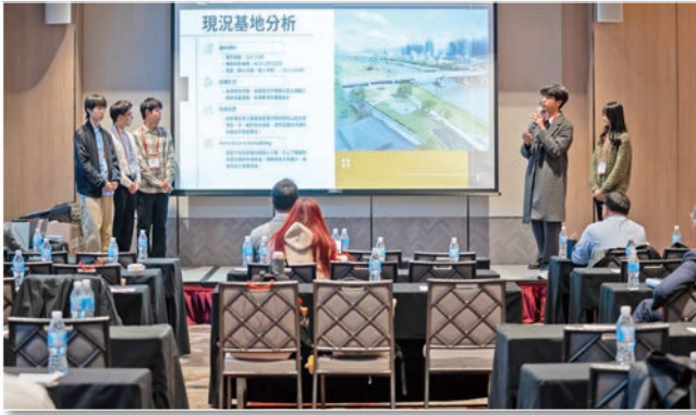
國立臺灣大學土木工程學系 爆肝築橋部 發表