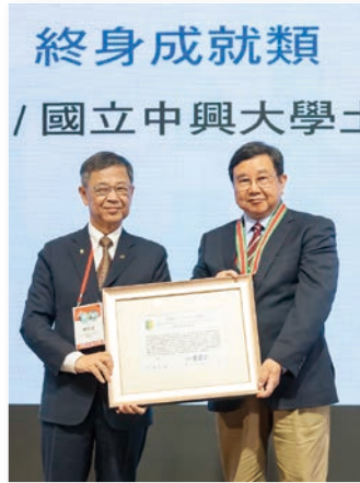
終身成就類得獎人 林其璋名譽教授