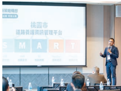
桃園市道路養護資訊管理平台 — 智慧巡路幸福公路