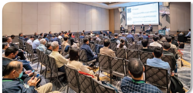
現場貴賓聆聽講座