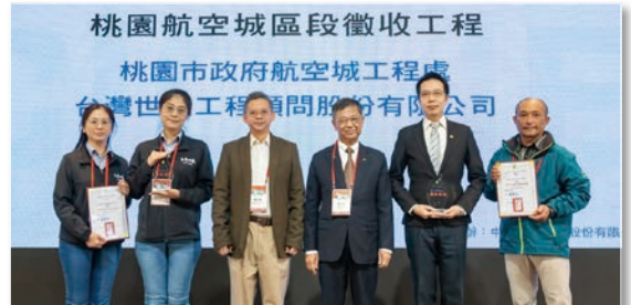
桃園市道路養護資訊管理平台—智慧巡路幸福公路