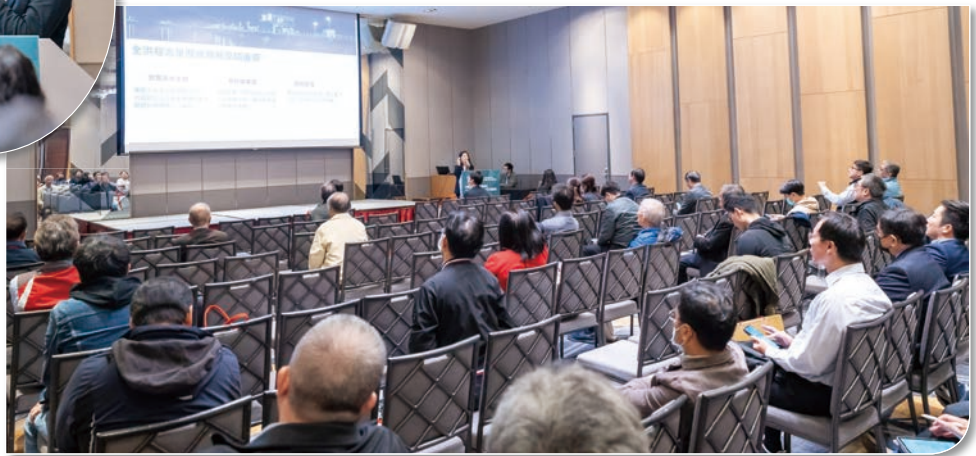
現場貴賓聆聽講座