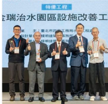
特優 – 金瑞治水園區設施改善工程