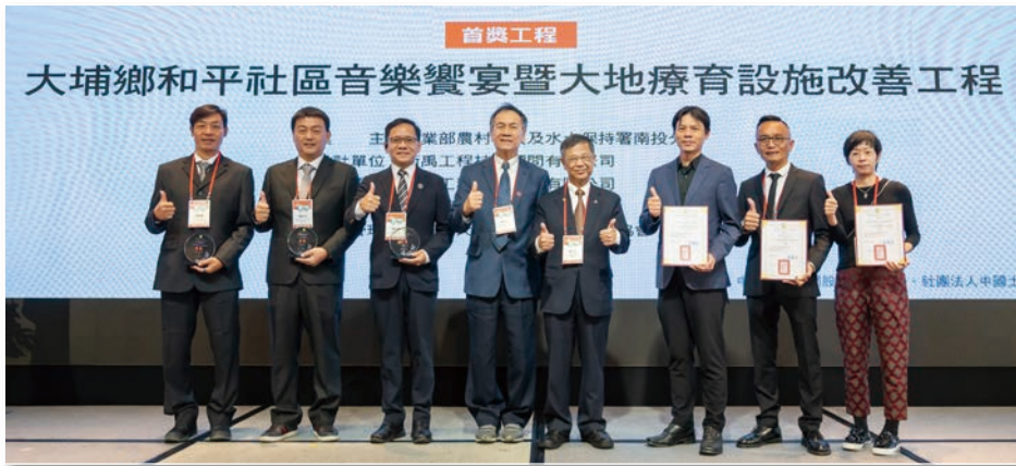
首獎 – 大埔鄉和平社區音樂饗宴暨大地療育設施改善工程