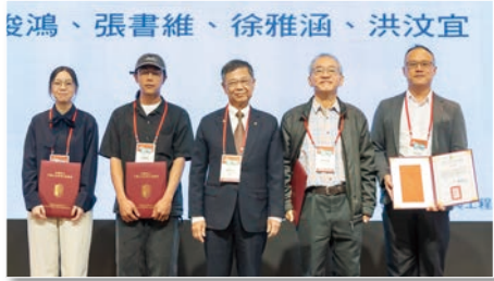
低矮建築物使用小口徑樁之抗液化效果： 離心模型試驗