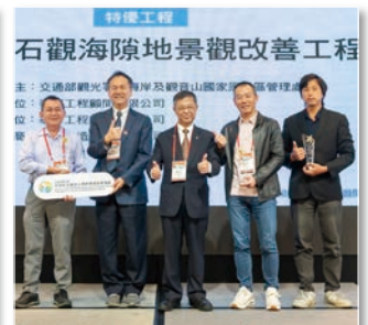
特優 – 金山跳石觀海隙地景觀改善工程