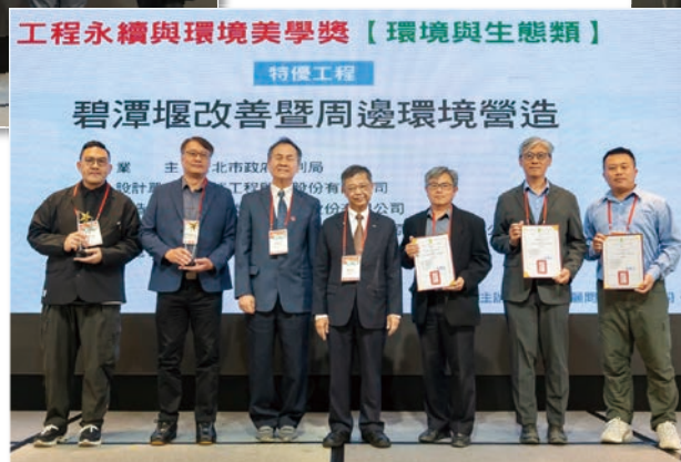
特優 – 碧潭堰改善