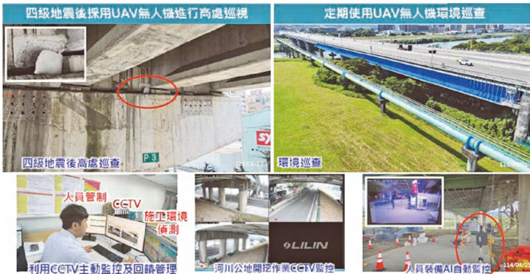
圖 7 利用 UAV 巡檢與 CCTV 監控巡查