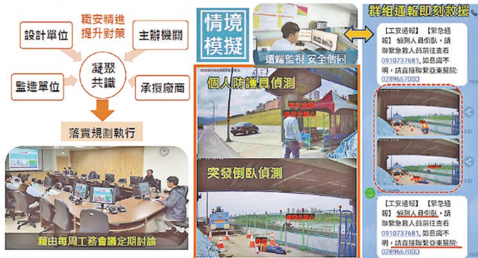
圖 10 工地出入管制統一的監控介面