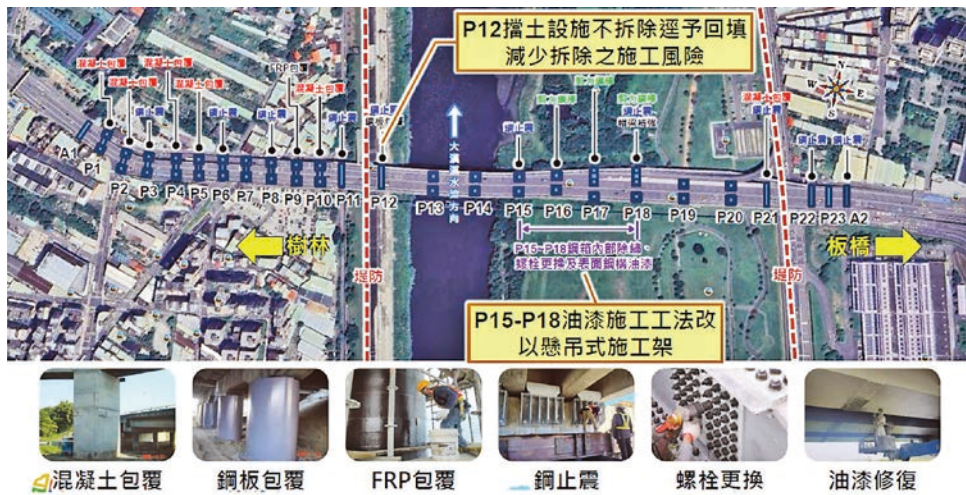
圖 1 浮洲橋耐震補強工程施工內容

局與施工團隊宸茂營造攜手導入「智慧工地」(Smart Construction Site) 管理理念，利用數位科技與創新措施提升狹長型工地的管理效能與安全性。以下將從提升施工效率、強化品質管理、確保勞工安全防護及實現永續發展等幾大主軸，闡述本工程應用智慧工地策略的核心作法與成效。