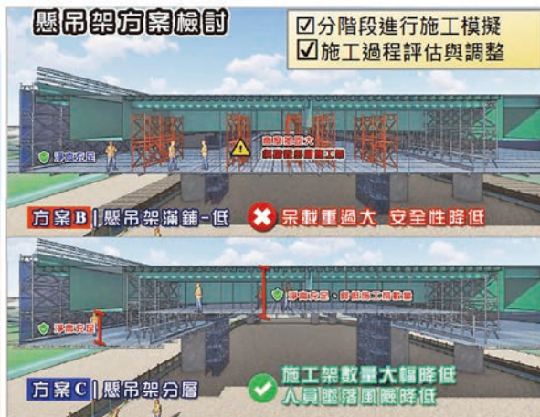
圖 2 運用 BIM 數位模型進行設計協調與衝突檢討，降低施工風險