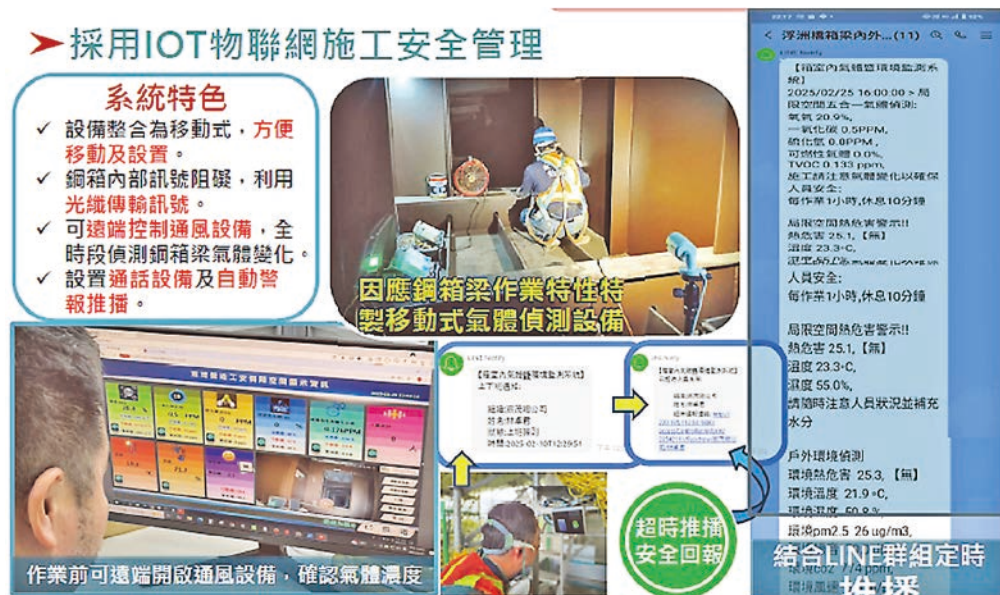
圖 9 導入 IoT 感測設備監控環境及設備安全狀態

推行安全文化與智能培訓，本工程施工單位宸茂營造秉持「安全至上、生命無價」的政策，將職業安全衛生納入企業經營理念並投入充足資源。在智慧工地的框架下，所有工人進場前必須透過線上安全教育系統完成培訓課程（如圖 7），包括 VR 模擬體驗常見工地危害情境，以提升風險意識。現場每日晨會則結合電子看板公布當日施工風險提示和安全提醒，使安全訊息「看得見」並深植人心（如圖 10）。建立完善的安全稽核與激勵機制。工務局與監造單位運用數位稽查系統，每週對工地進行安全巡檢，透過平板即時記錄檢查結果並拍照存證，不符合項目自動生成整改通知單並限期追蹤。最高管理階層定期查看系統稽核報告，強調「職安衛重要決策直達最高管理層」。在激勵方面，建立「安全績效獎勵制度」，對於零事故工班及積極改善安全隱患者給予獎勵，營造互相比拼安全的良性競爭氛圍。施工過程中也落實了多項創新安全工法，例如採用新型模組化鷹架與安全扣件，提升架設穩定性並以顏色區分承重構件，方便快速辨識危險等級；利用特製立柱連結器及桁架替代傳統鋼管，強化支撐結構且減少高空組裝作業，大幅降低高處墜落風險。在所有這些智慧安全舉措的加持下，本工程自開工以來保持零災害、零事故的紀錄，再次印證智慧工地管理對於勞工安全的助益。