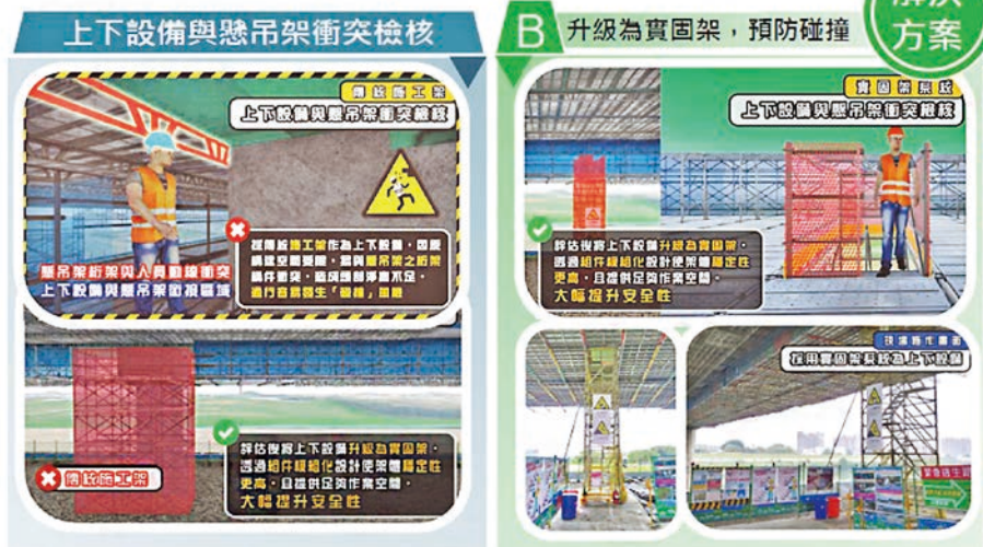
圖 3 運用 BIM 數位模型預先排出施工障礙，施工衝突檢核