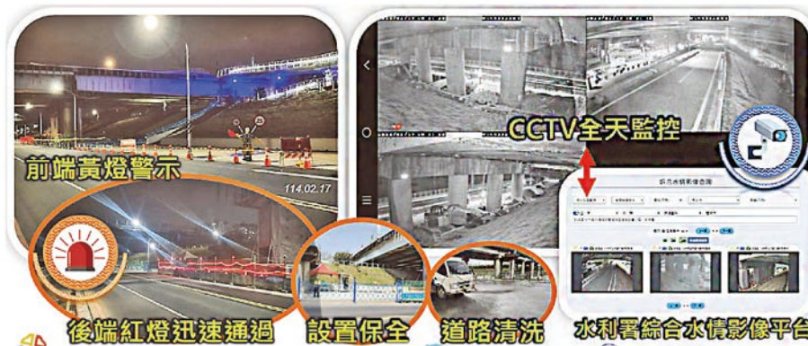
圖 4 物聯網 (IoT) 感測裝置與遠端監視系統

反應時間。例如在汛期，系統偵測到大漢溪水位上升接近警戒時，立即通知現場停止河道內施工並撤離人員機具。此外，透過工地即時影像監看，管理者即使不在現場也能掌握施工情形並遠端指揮調度，提升決策效率。當颱風來襲時，工務局與施工團隊運用這套智慧監控系統，在最短時間內完成高灘地機具撤離及防汛布設，成功避免災害損失。同時，為加速施工流程，本工程採用了電子化文件與雲端協作機制來簡化行政程序。例如，所有施工紀錄、會議紀要等均上傳共享平台，各單位即時查閱回報，省卻傳統紙本往返耗費的時間。在智慧管理措施加持下，浮洲橋補強工程雖施工環境艱鉅，仍能如期甚至提前達成階段目標，充分展現智慧工地在提升施工效率方面的價值。