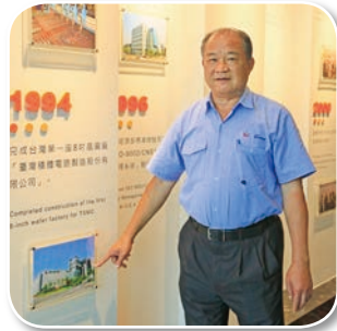
1994年台積電第一座廠房