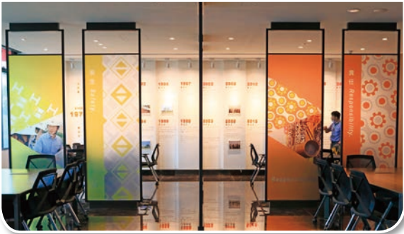
進門就可以看到世紀鋼的歷史牆