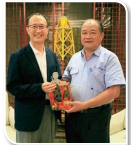
賴董事長回贈紀念品