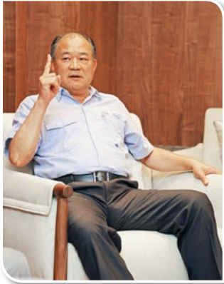
開創事業就是靠決心跟霸氣

因為對於水下基礎領域的經驗有限，我們派員前往歐洲進行學習，發現不僅僅需要專業上的技術，擁有一個重件碼頭也是不可缺少的條件。然而當時離岸風電材料關稅和海運費用的高昂，重件碼頭的用地租金費用高，且需重新規劃廠房，在當時這個想法遭到了公司董事的反對，他們認為成本風險過大。然而，走到今天，隨著技術的成長及市場需求量的提升，才真正了解擁有重件碼頭是多麼重要，否則即便具備技術，也無法找到適當的場所加以應用。