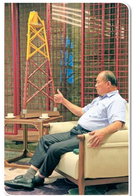
我們努力不懈成為世界 Number One