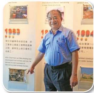
1983年從三個人的鐵工廠起家