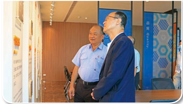
賴董事長親自解說世紀鋼的發展史