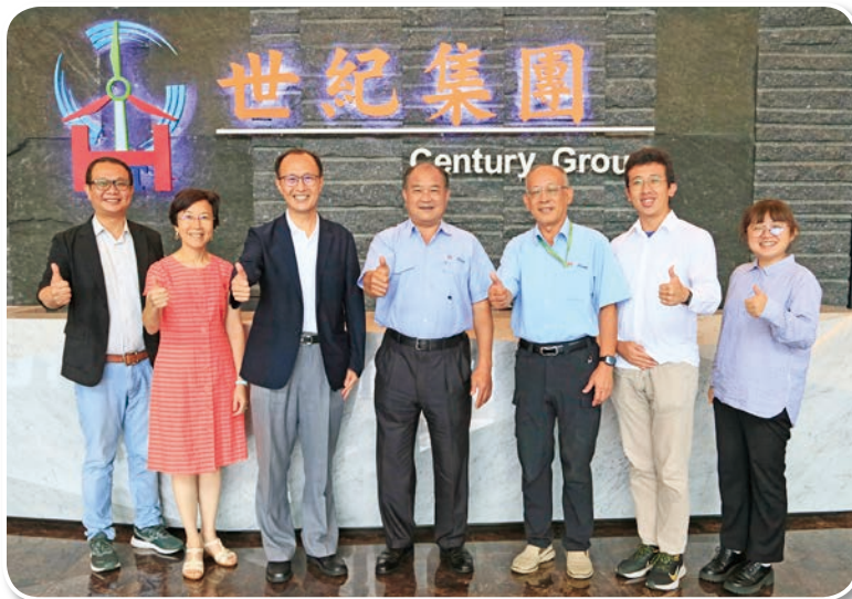
世紀鋼 - 讚!