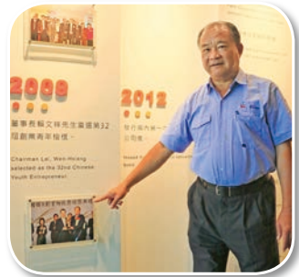
2009年當選第32屆青年創業楷模