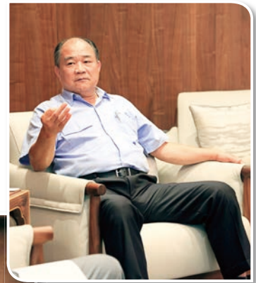
經營最困難的就是錢

A 我們認為經營最困難的挑戰是「資金」方面的問題。隨著事業的擴張，所需的資金也隨之增加。每一個合約的金額都相當龐大，尤其在這個新型產業中，我們需要投入資源來興建新的廠房、培訓新人、掌握新的工法等。在這其中，高達 90% 都是全新的投入，都需要大量資金。此外，土地的限制、最初階段國外廠商的競爭，一路走來可說是困難重重。尤其在離岸風電發展之初，國內銀行及保險公司對此產業大多既不熟悉也無信心，幸好隨著世界對綠電需求持續增加的趨勢，加上政府的大力推動及鼓勵，才慢慢逐漸減輕了銀行對此產業融資與放貸的疑慮。