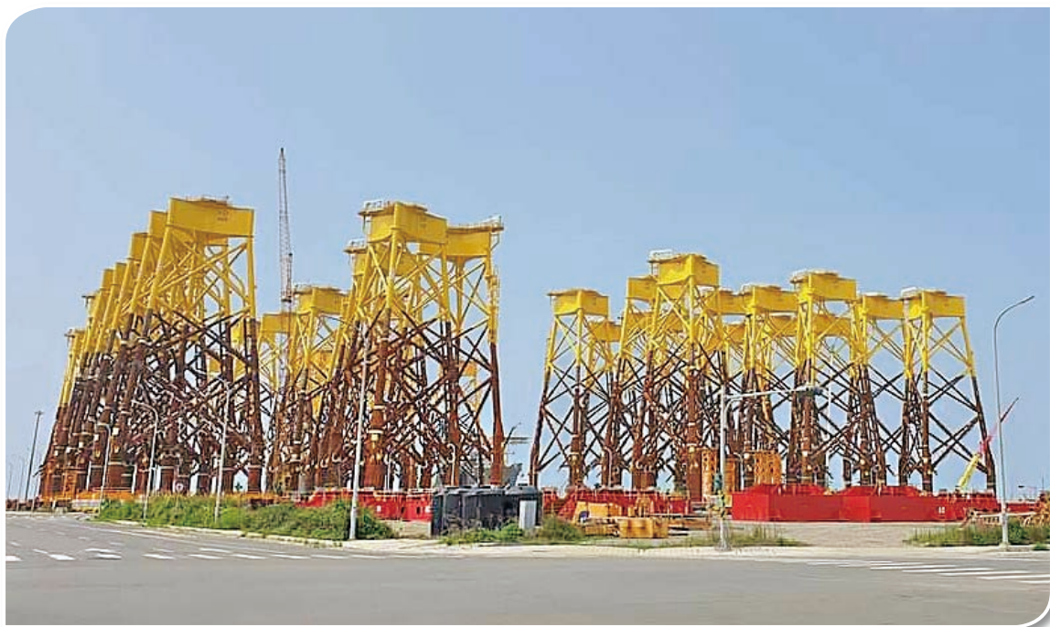
第一批國人自製的 Jacket Tower