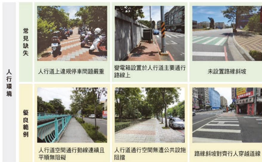
圖 2(b) 人行環境常見缺失及優良範例