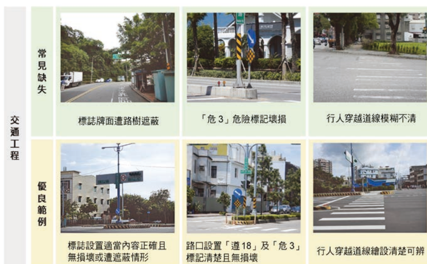
圖 2(c) 交通工程常見缺失及優良範例