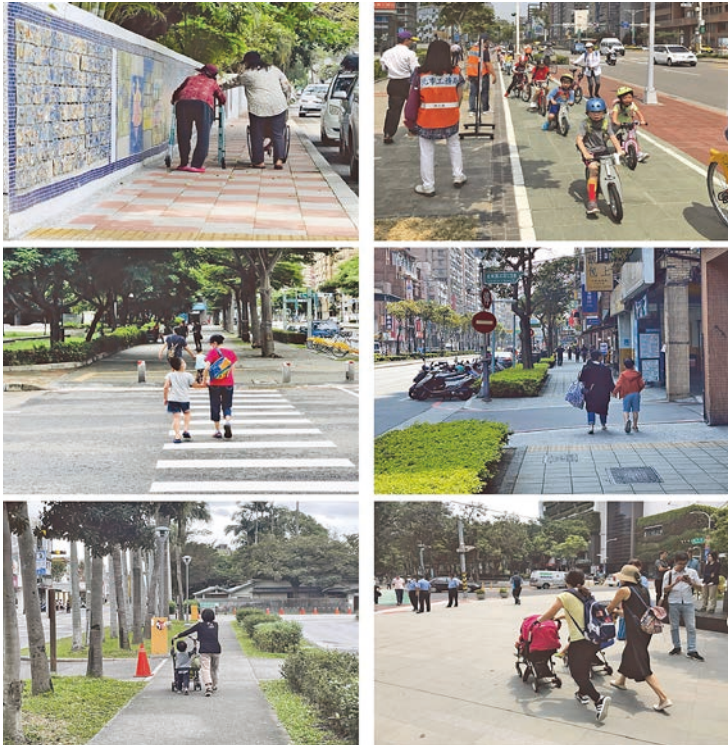
圖 5 在街頭看到愛與幸福