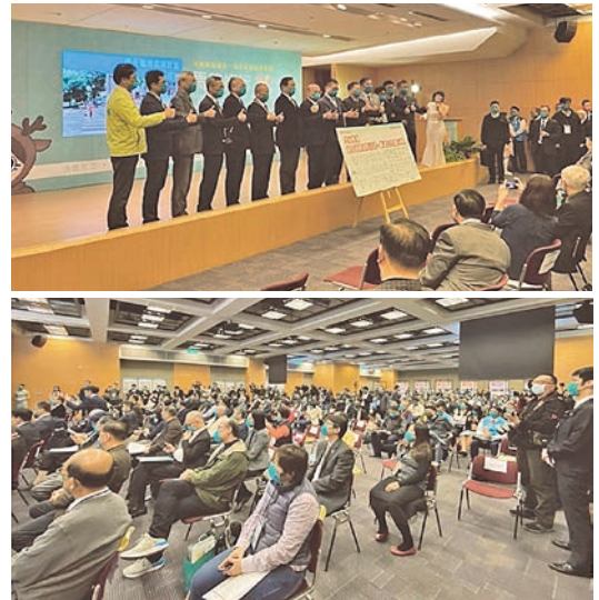
圖 6 馬路好行頒獎典禮

地面對挑戰進行修正，未來中央政府與地方政府會秉持著同樣的精神繼續為大家的共同環境而努力，期待我們的未來會更加美好，也期待我們的城市再次偉大，達到馬路真好行的最終標的，圖 6 為今年馬路好行頒獎典禮情形。