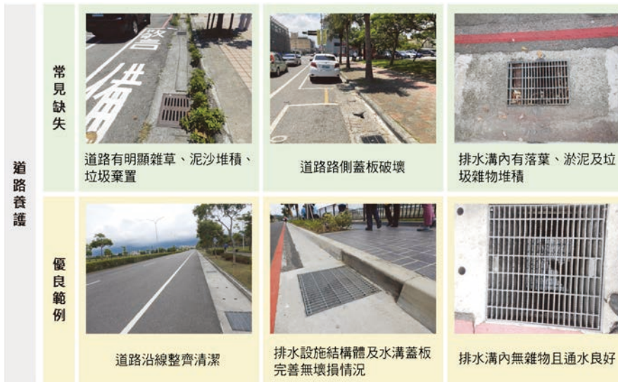
圖 2(a) 道路養護常見缺失及優良範例

經過16年的共同努力，無論在道路養護、人行無障礙環境、交通工程與景觀設計上都有長足的進步，也看到許多貼心的設計慢慢地