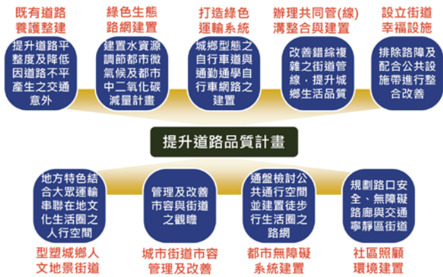
圖 3 提升道路品質計畫「九大指標」

形成，雖然我們不斷在困難中獲取經驗，也不斷地在綜整大家觀點來取得共識，在全台灣各地無論是人口集中的六都，或是人口較稀少之鄉鎮，皆可看到我們共同努力的痕跡，雖然我們的城市過去或是現在仍有許多需要改進之處，但經過我們點點滴滴的努力，慢慢地形成一個宜人環境，我們 16 年來點點滴滴改善的部分如圖 4 所示，從以前困難重重到現在街道上可以尋找到我們想要的小確幸或大幸福，證明我們只要持續的去改變、持續的去努力，有一天我們的城市會將更偉大。