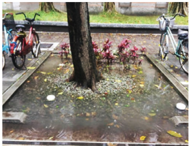
圖 2 國立臺灣大學桃花心木道植生溝槽於大雨時蓄水之情況