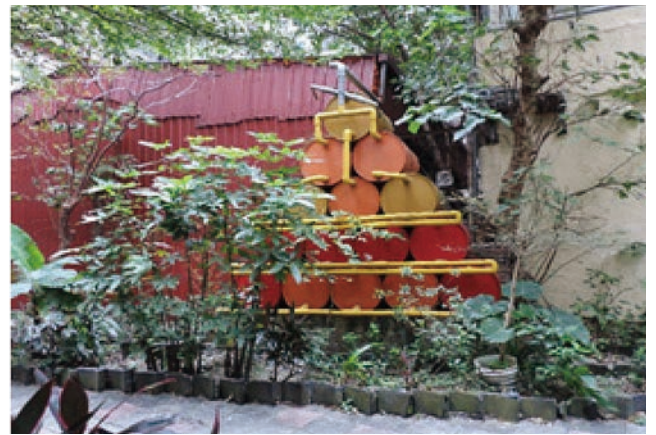
圖 4 臺北市羅斯福路綠點 — 雨水花園

羅斯福路的雨水花園工法是屬於地上型雨撲滿，於地面架設雨撲滿，雨撲滿有管線連接著出水口。根據調查，該案例植栽種類有 29 種，例如朱蕉、唐竹、紫薇、變葉木、蜘蛛百合、鳶尾、法國秋海棠、美人蕉與翠盧莉等，植物多樣性高。植物生長尚可至良好，但較缺乏維護管理，有些區塊植栽稀疏而降低美觀性，此外，園區土壤含水量較低，因此公園的灌溉設施以及儲水桶的實用性皆有待進一步檢討。