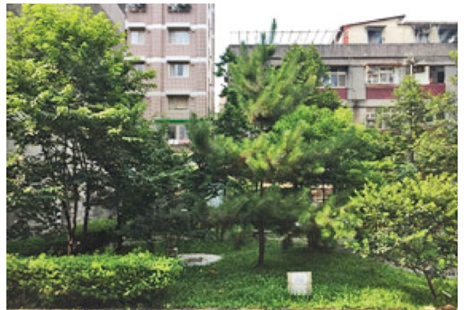
圖 5 臺北市大安區油杉社區 LID 公園