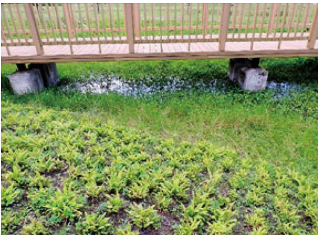
圖 3 臺北市南港區玉東公園