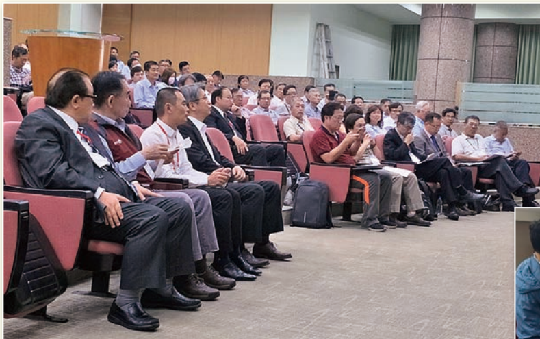
2018 水工程國際研討會研討會現場