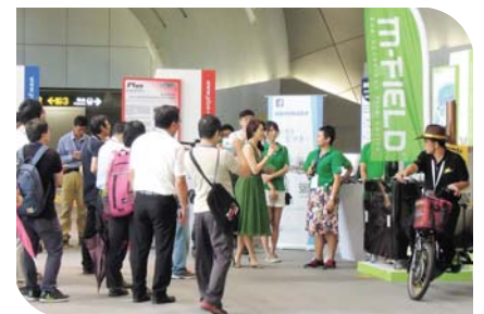
105/7/29 開幕式主持人介紹參展廠商

節能環保是都會生活的趨勢，搭乘捷運可以省去其他能源的消耗，減少碳排放，捷運公司的立場就是鼓勵民眾多搭乘捷運系統，藉由觀念的推動，形成文化，在生活中感受。臺北市政府捷運工程局局長張澤雄表示，捷運大安森林公園站的設計與公園、綠地、陽光結合，使用環保建材，曾獲得全球卓越建設獎，是全市捷運的指標站點，利用太陽光電，將水轉換成氫氣成為燃料電池進行儲存，每月可以供應1千度的電力供公園使用，不但節能減碳，也有產能。本學會理事長呂良正指出，永續節能使建築業受到重視，政府重視新能源，透過這項體驗活動讓國人認識氫燃料電池。