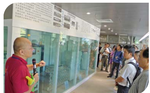
導覽低耗節能展示屋

配合世界各國積極進行減碳政策以遏止氣候暖化的目標，本學會藉由辦理本次研討會，讓國人認識車站工程美化的特質、低耗節能展示屋的環保綠能及氫燃料電池，除透過動畫介紹氫能燃料電池原理與應用、簡報燃料電池最新發展資訊、欣賞德國環保之旅影片、實際動手操作燃料電池教具及示範新型教具，活動現場還有台灣經濟研究院邀請之博研、美菲德、錫力、群翌、鼎佳、宏進、高力等國內重要的氫能燃料電池業者，現場公開展示燃料電池發電設備、交通載具、氫燃料電池科學體驗及等活動。新能源發展是各先進國家的重要政策，其中氫能與燃料電池為穩定潔淨之電力，具節