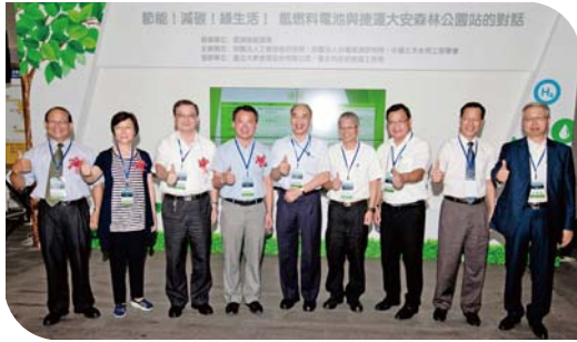
105/7/29 開幕式主辦單位代表合影