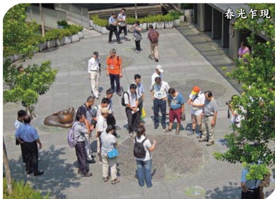
大安森林公園站 公共藝術