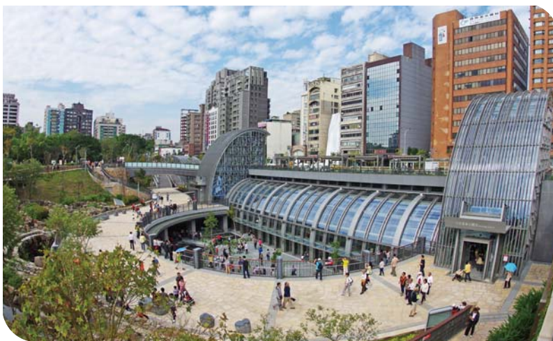
捷運大安森林公園站

中國土木水利工程學會致力於對國家「永續」、「綠營建」與「能源」發展的使命，同時配合政府因應全球氣候變遷，落實環境正義的目標，善盡共同保護地球環境的責任；非常榮幸承經濟部能源局指導，由本學會與財團法人台灣經濟研究院、財團法人工業技術研究院、臺北市政府捷運工程局以及臺北大眾捷運股份有限公司，共同攜手，於 105 年 7 月 29 日及 30 日，在大安森林公園捷運站陽光大廳舉辦「節能！減碳！綠生活！— 氫燃料電池與捷運大安森林公園站的對話」觀摩研討體驗。