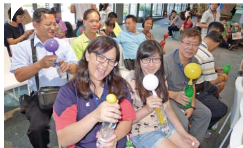
體驗二氧化碳捕存技術

能減碳之優勢，目前國際上已廣泛運用在不同發電裝置，包含大型發電機，及新能源汽車、摩托車、3C 電子產品之電力來源；台灣氫能與燃料電池結合了上游（原料、零組件）、中游（燃料電池）、下游（系統廠、電池應用），產業鏈完備，燃料電池產業已具備完整技術及國際競爭力，為配合世界各國積極進行減碳政策以遏止氣候暖化，在國內發展新能源產業實屬必要。