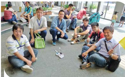
氫燃料電池驅動小跑車體驗成功

能減碳之優勢，目前國際上已廣泛運用在不同發電裝置，包含大型發電機，及新能源汽車、摩托車、3C 電子產品之電力來源；台灣氫能與燃料電池結合了上游（原料、零組件）、中游（燃料電池）、下游（系統廠、電池應用），產業鏈完備，燃料電池產業已具備完整技術及國際競爭力，為配合世界各國積極進行減碳政策以遏止氣候暖化，在國內發展新能源產業實屬必要。