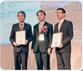
高雄市政府工務局 高雄市世界貿易展覽會議中心 統包工程