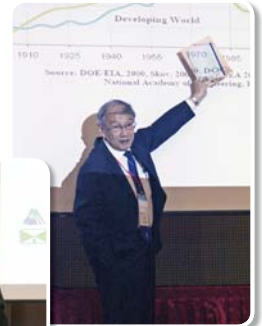
國際論壇主講人 中國 / 劉西拉教授