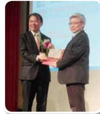
根基營造股份有限公司 財團法人海峽交流基金會 新建辦公大樓