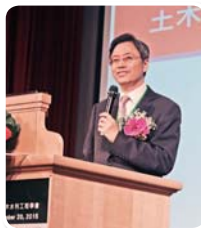
行政院張善政副院長 專題演講