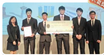
銅獎：TMTW 土木熱火（旗津跨港纜車） 國立聯合大學土木與防災工程學系