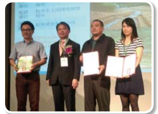
行政院農業委員會 林務局南投林區管理處 日月潭巒大區 29 林班坡面處理及 坑內坑溝處理工程