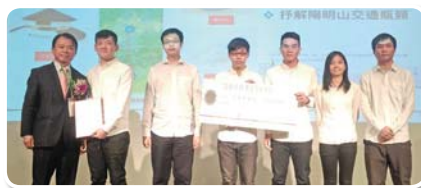
銀獎：不要纜著我（文景纜車） 國立臺北科技大學土木工程系