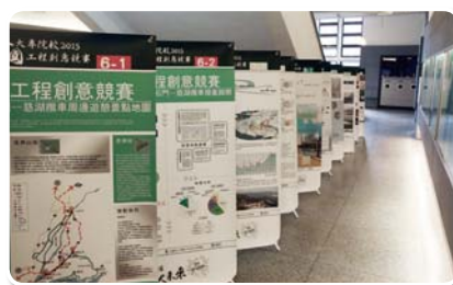
工程創意競賽參展作品陳列