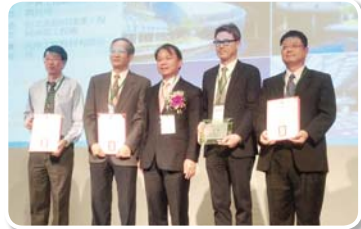
台北市政府捷運工務局南區工程處 台北市都會區大眾捷運系統 R09 (大安森林公園) 車站工程