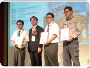
台北市政府工務局大地工程處 103 年度土石流潛勢溪流改善及 設施維護工程 (第一期)