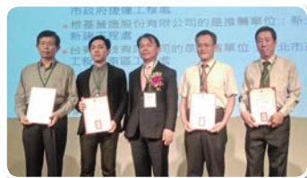
推薦單位感謝狀 - 全體合照