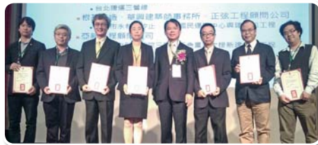
技術優良獎 - 全部得獎單位合照

中興工程顧問股份有限公司 林口國宅暨 2017 世大運選手村新建統包工程第一標 台灣世曦工程顧問股份有限公司 台北捷運三鶯線 根基營造股份有限公司 新北市永和、汐止、樹林國民運動中心興建統包工程 亞新工程顧問股份有限公司 新北市立聯合醫院三重院區急重症大樓新建統包工程 台賓科技有限公司 和平國小暨籃球運動館新建工程