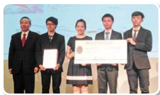
金獎：木款隊（員份纜車） 國立台灣大學土木工程學系