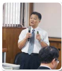
夏明勝副局長 交通部公路總局