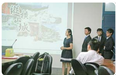
工程創意競賽發表