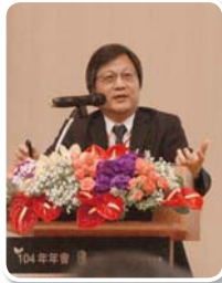
國際論壇主講人 台灣 / 劉格非教授