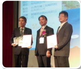
高雄市政府工務局新建工程處 旗津區海岸線保護工程