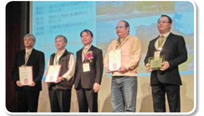
台北市政府工務局新建工程處 中山北安路 501 巷林蔭大道工程