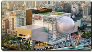
封面 上：高雄市立圖書館總館鋼樑吊裝完成。 相片 下：台北藝術中心建築意象。