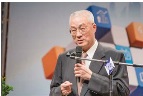
吳副總統敦義先生致詞