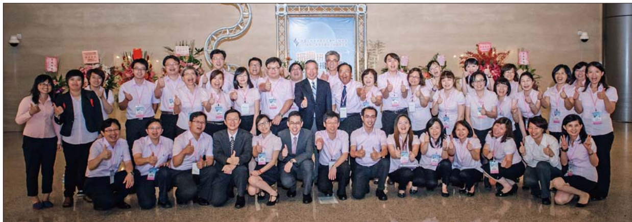
中國工程師學會 103 年年會工作團隊讚！