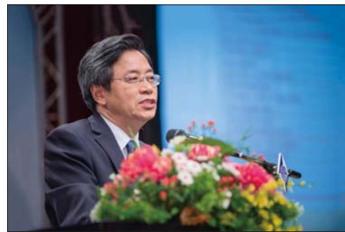
科技部張部長善政專題演說