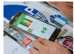
105年新創 土水活動誌APP

此次年會還有個創舉，就是土水活動誌APP的推出，用智慧手機就可以一手掌握年會的最新資訊、各項細節，而且隨時更新。善用雲端科技輔助，節能減碳，是學會未來的工作方向。學會功能要與時俱進，持續推出新的服務，和所有會員一起邁向大未來。