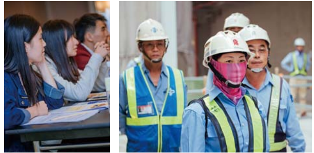
歡迎越來越多女性加入土木工程的行列

今年特別在年會大會中，首映台灣公共工程檔案的第一部微電影，講述新店溪流流域水力發電廠的故事。這是由曾元一董事長發起的專案，以保存台灣的公共工程記錄為志業。有文字、有電影，除記錄外更