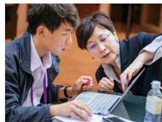
認真、努力、就是要最好 會議進行中還在討論檔案

想要襯托這麼高級的場地，今年的年會勢必要卯足了勁來辦，一定要精彩可期，讓與會會員感受到熱烈氣氛，表達學會舉辦年會的熱忱。因此我們準備全方位演出，舉辦工程參訪、國際論壇、年會大會、年會工程論壇、廠商展覽、晚宴等等，從頭到尾都是以最高標準來辦理。