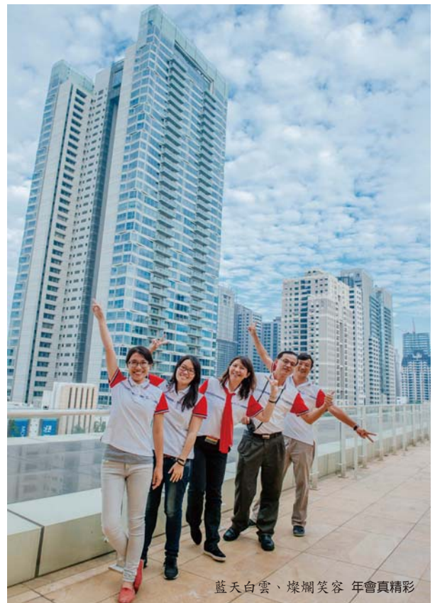
藍天白雲、燦爛笑容 年會真精彩

早在五月份，秘書處和麗明營造即開始籌備工作，地點幾經商討才拍板定案於「台中林酒店」舉行，隨即南下台中看場地。林酒店由麗明營造興建，位於台中市七期重劃區，是台中市最新、最高級的酒店。第一次看到林酒店的氣派與豪華，老實說，只能用瞠目結舌四個字來形容。對從未在高級酒店辦年會的我們來說，簡直就是一個 mission impossible。此外場租、餐飲的高消費也讓我們卻步，幾度有意更換場地，這時候麗明營造表示，經費他們會想辦法，學會可不必太擔心，有了這句話，我們才真正開始規劃各項活動。