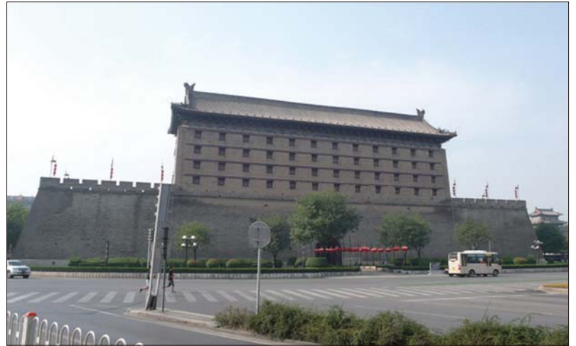
圖 2 唐朝所建長安城（戰術之城）南側

萬里長城係由秦始皇將原來北方諸國所建防衛匈奴的城牆連接起來而成。秦始皇集重兵於咸陽，但修直道（後世稱之為秦直道）通往長城，當匈奴攻打長城之時，駐在咸陽的騎兵或戰車部隊，可以迅速衝往長城支援。