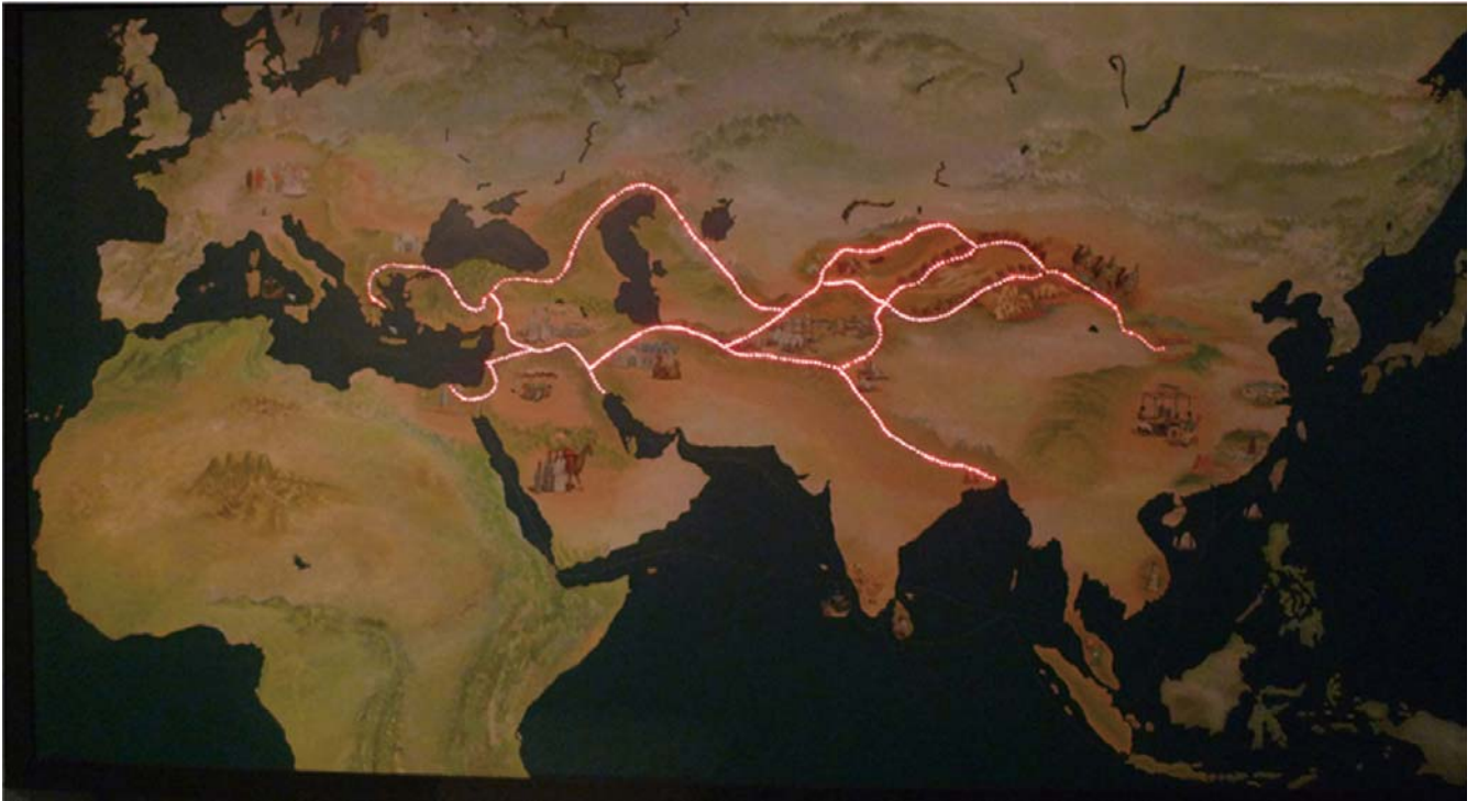
圖 5 古代絲綢之路（洲際貿易、文化交流與文明接觸之道路）路線網絡簡圖