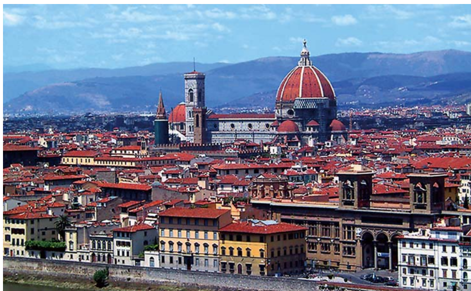
圖4 義大利翡冷翠（Firenze），以聖母百花大教堂為範疇所建設的神聖之城，文藝復興的發源地，也是義大利少數最富裕城市之一（洪如江攝）

為記帳、紀錄、傳遞訊息（包括命令、法規、信件）、與教育，發明文字，書寫於樹皮、獸皮、泥板、紙張，或雕刻於竹片、木片、石碑、石牆、石柱，「書寫歷史」開始，人類主流文明從此誕生並向前發展。