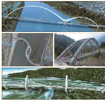
(上) 新月橋 (中左) 高美濕地景觀橋 (中右) 科子林橋 (下) 白米景觀橋